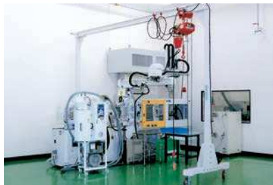
電動モートルブロック付き

標準タイプは手動チェーンブロックですが、電動モートルブロックの取付もできます。(オプション)